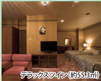
デラックスツイン(約55.3㎡)