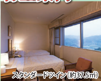
スタンダードツイン(約37.5㎡)